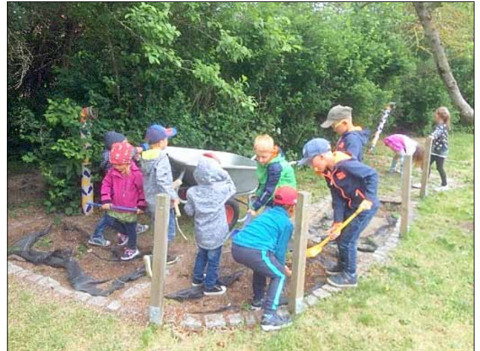
Alle packen fleißig mit an

So sah der Barfußpfad vor Beginn der Arbeiten aus.