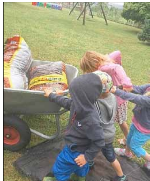
Gemeinsam sind wir stark!