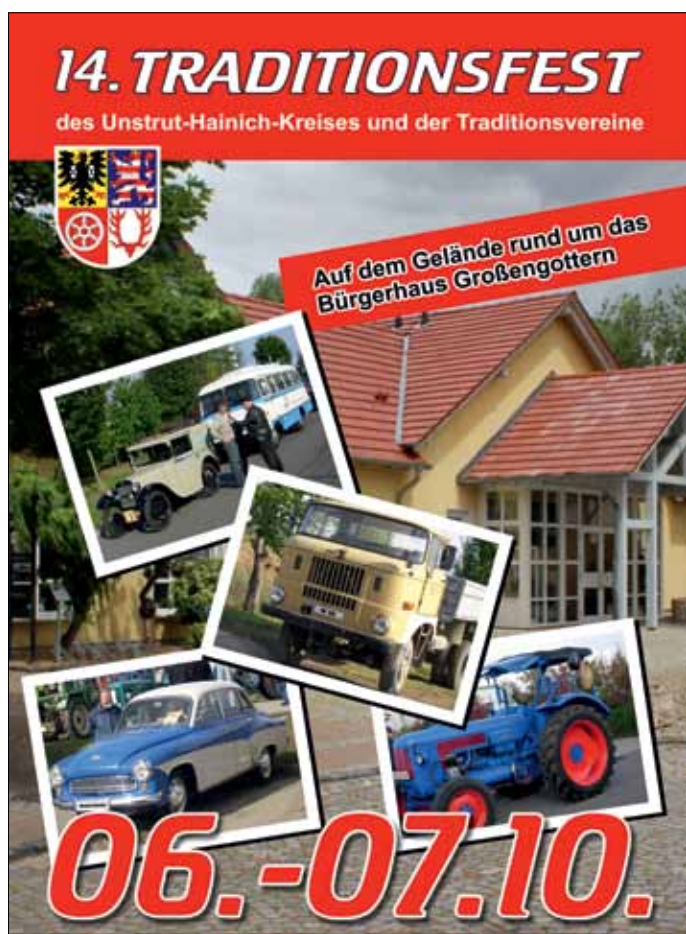
Mit freundlicher Unterstützung der Sparkasse Unstrut-Hainich.