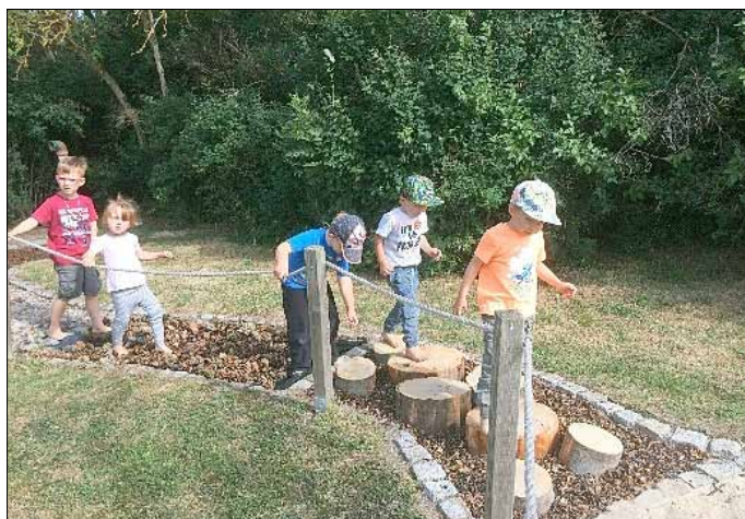
Und jetzt wird erstmal getestet