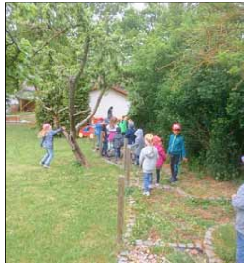
So sah der Barfußpfad vor Beginn der Arbeiten aus