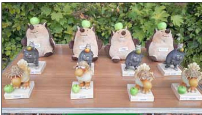
Die begehrten selbstgebastelten Pokale