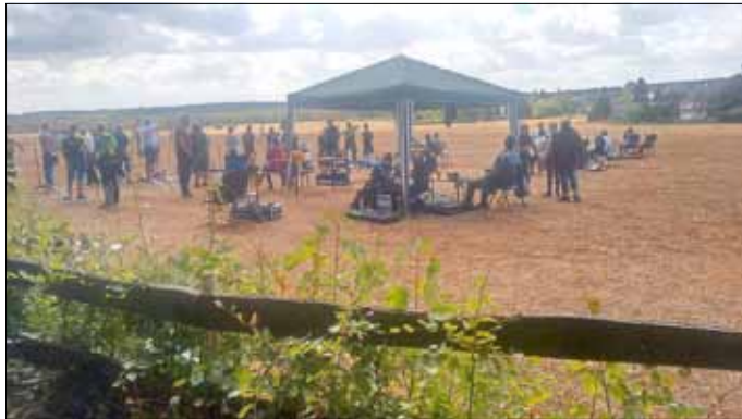
Eintreffen der Gäste