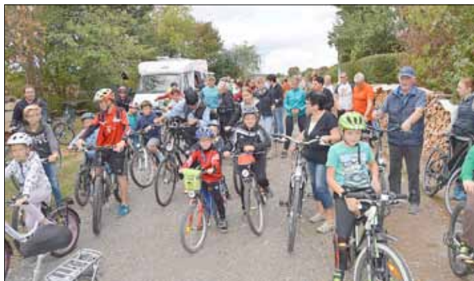
Spannung vor dem Start

Ein herzliches Dankeschön geht an alle Mitwirkenden, alle Helferinnen und Helfer und den VfL Hüpstedt.