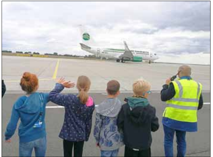
Start eines Flugzeugs